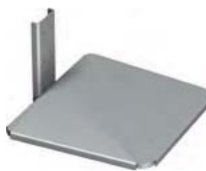
RUSTFRI AFTAGELIG PLADE En løs aftagelig plade i rustfri stål. Placeres over standard plastpladen