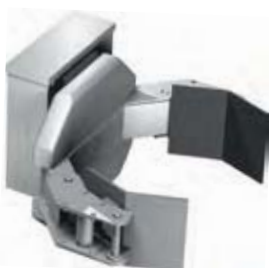
KLEMME OG VENDEAGGREGAT Tønder gasflasker og andre cylindriske emner Kan vende dem op og ned