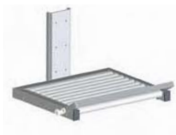
RULLEBANER Til enkel af- og pålæsning af tungt gods Med lastfiksering