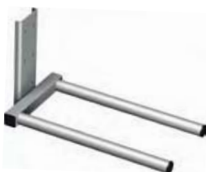
GAFFEL Et alsidigt værktøj til såvel paller som ruller