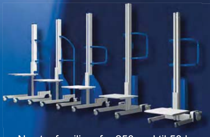
Newtonfamilien, fra 250 ned til 50 kg