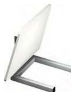
PLADE DER KAN KLAPPES OP Denne kombination med plade og gaffel giver vognen et stort anvendelsesområde.