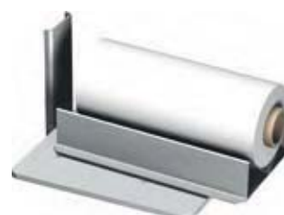
V-blok til ruller Til sikker håndtering af ruller eller andre runde emner.