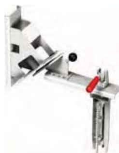
RULLEVENDER Fra vandret til lodret position eller hele vejen rundt. Med expander