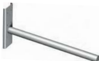
ENKELT BOM Til ruller, dæk mm. Løfter alt med et hul eller en krog.