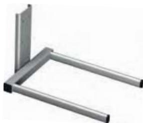
EU-GAFFEL Et værktøj til EU-standardkasser