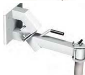
FORSTÆRKET EKSPANDER Løfter, vender og drejer tungere ruller.