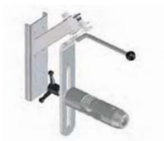
EXPANDER En expander der håndterer og placerer ruller horisontalt eller vertikalt.